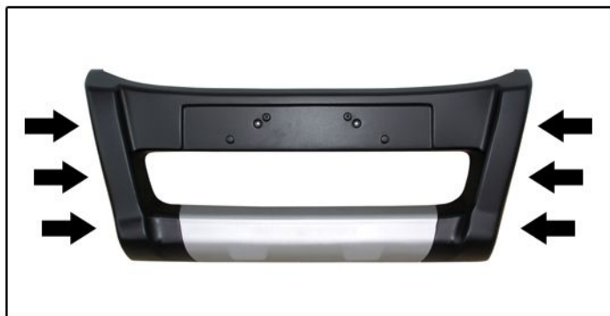
C) Fixar as borrachas de acabamento nas laterais da peça.