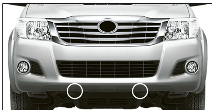
E) Retirar os grampos localizados na parte inferior do para-choque.