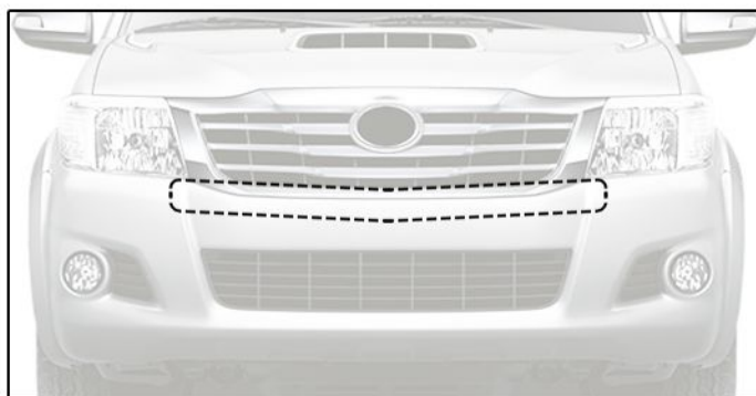
B) Limpar a área de aplicação da fita dupla face conforme posicionamento no para-choque.