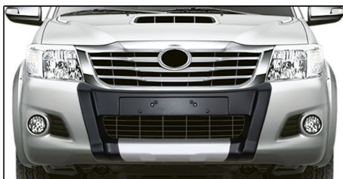
F) Posicionar o overbumper no para-choque do veículo conforme furação.