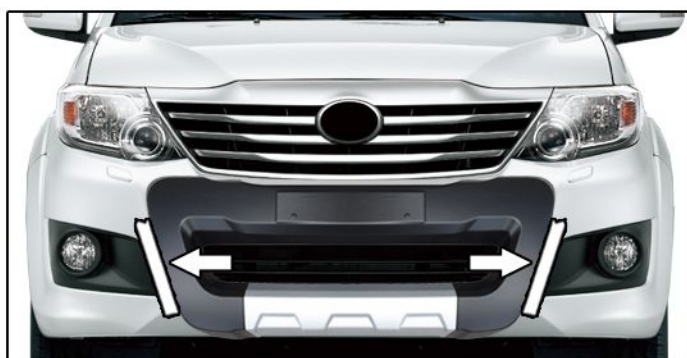
D) Posicionar o overbumper no para-choque do veículo alinhando-o conforme marcação da fita na etapa "B".