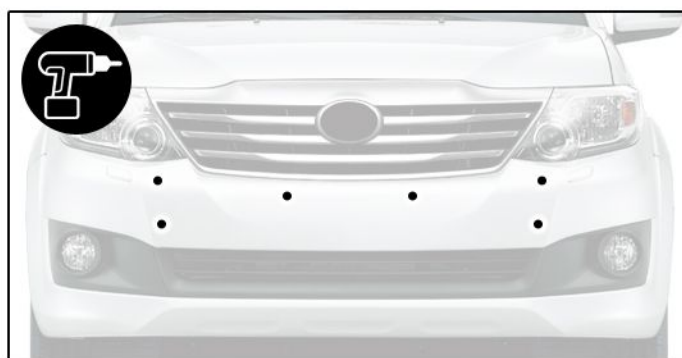
E) Depois de posicionar o overbumper, fazer a furação conforme locais marcados com tinta na etapa anterior.