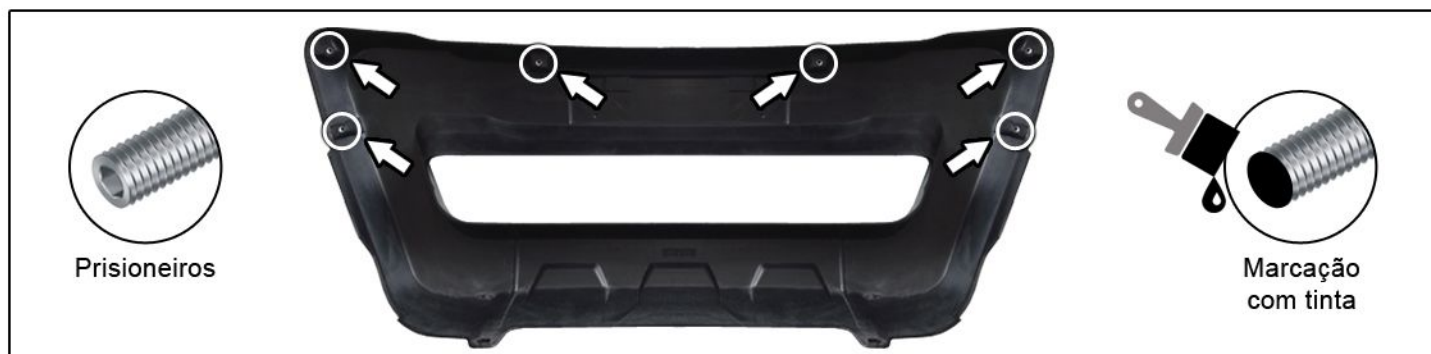
C) Inserir os 6 prisioneiros nos insertos da peça conforme locais indicados. Em seguida, fazer uma marcação com tinta na ponta dos prisioneiros (essa marcação serve p/ verificar os locais de furação do para-choque conforme etapa seguinte).