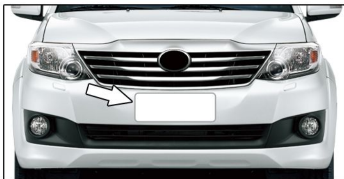
A) Retirar a placa dianteira do veículo.