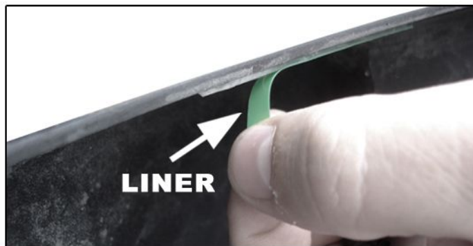
D) Desgrudar uma ponta (liner) da fita adesiva do overbumper para facilitar sua retirada posteriormente.