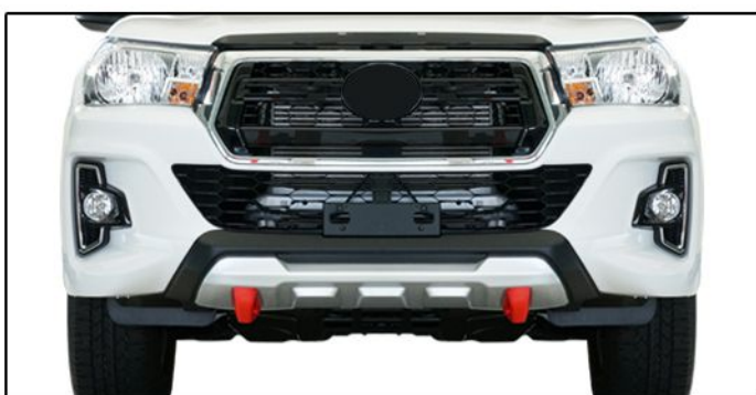
E) Posicionar corretamente o overbumper no para-choque do veículo.