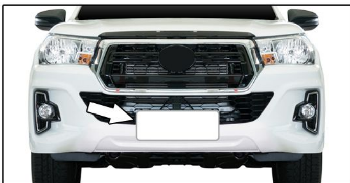
A) Retirar a placa dianteira do veículo.