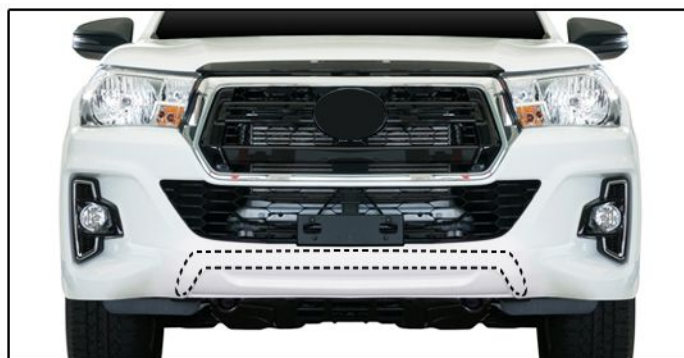
B) Limpar a área de aplicação da fita dupla face conforme posicionamento do overbumper.