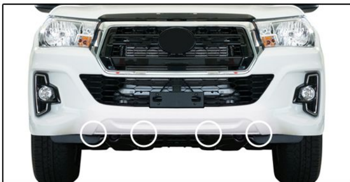
C) Retirar os 4 parafusos localizados na parte inferior do para-choque conforme posicionamento do overbumper.