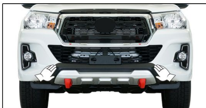
F) Retirar o restante do liner e pressionar a área de aplicação da fita dupla face.